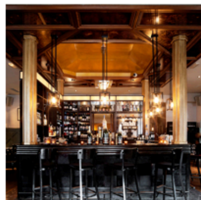
Thiou déboule à Auteuil avec Mary Good Night