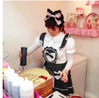
Un goûter rose kawaiï dans le Marais chez Princess Crêpe