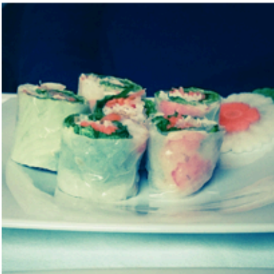
Must-eat à l'Alma : la table du Vietnam !