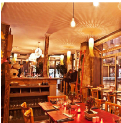
La nouvelle table des branchés : John Weng