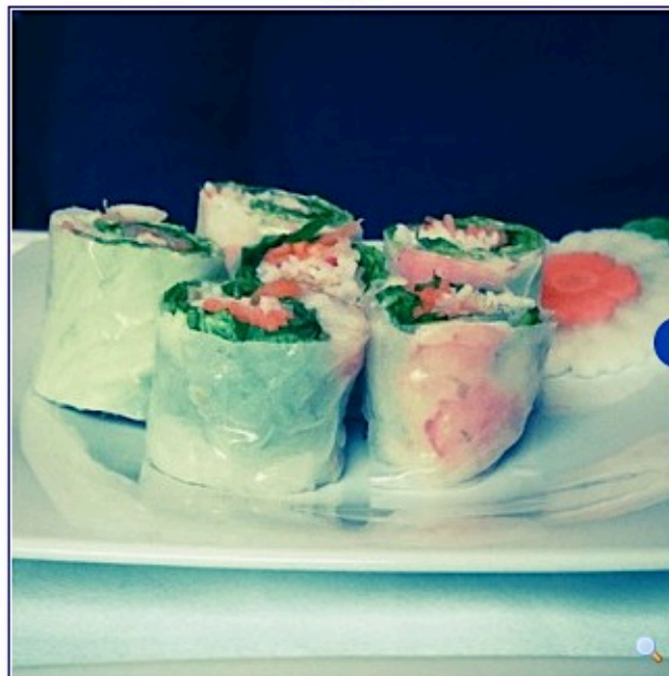
Must-eat à l'Alma : la table du Vietnam !